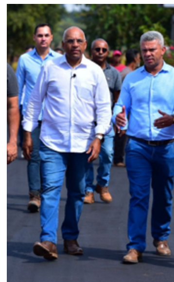
Prefeito Rogério Cruz e comitiva vistoriam oito obras de infraestrutura

O compromisso seguinte foi na Avenida Vicente Rodrigues, no Residencial Buena Vista, que passa por terraplanagem e pavimentação. A região foi atendida no último Mutirão da Prefeitura. A última obra da agenda foi na intervenção de terraplanagem e pavimentação da Alameda Câmara Filho, no Parque Oeste Industrial, que também passou por alargamento de pista.