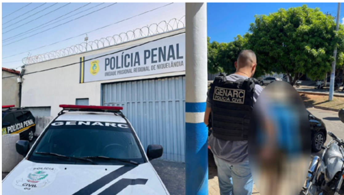
O mandado de prisão preventiva foi expedido no mesmo dia da prisão, evidenciando a eficiência e a celeridade das ações policiais

O indivíduo, que estava foragido desde 2019, era procurado por um homicídio cometido no município de São Luiz do Norte. O mandado de prisão preventiva foi expedido no mesmo dia da prisão, evidenciando a eficiência e a celeridade das ações policiais. A captura do foragido é resultado de um trabalho coordenado e estratégico do GENARC, que utilizou diversos recursos de inteligência