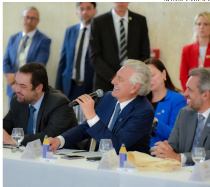
Ronaldo Caiado comenta dados do primeiro resultado do Compromisso Nacional Criança Alfabetizada

O ministro da Educação, Camilo Santana, destacou a conquista da educação brasileira no período pós-pandemia. “Retornamos ao patamar de 2019, um avanço muito importante”, frisou. Naquele ano citado por ele, a média de alfabetização estava em 55%. Em 2021, em meio à pandemia de Covid-19, caiu para 36%. Já em 2023, foi