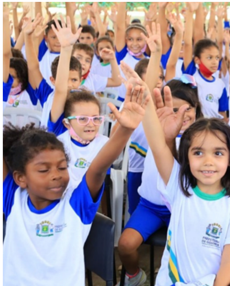
Compromisso Nacional Criança Alfabetizada busca garantir que 100% das crianças do 2º ano do ensino fundamental saibam ler e escrever

Para 2024, a meta de alfabetização almejada pelo governo é de 60% das crianças brasileiras. Esse percentual sobe para 64% em 2025 e 67%, em 2026. Nos anos seguintes, as metas sobem para 71% (em 2027); 74% (2028), 77% (2029), até superar os 80% a partir de 2030.