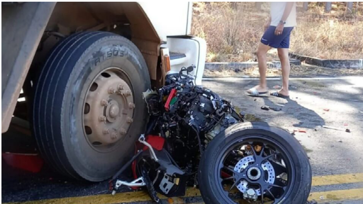
A brutalidade do impacto deixou a motocicleta irreconhecível e espalhou destroços pela pista, evidenciando a gravidade da colisão

A identidade do motociclista não foi divulgada oficialmente