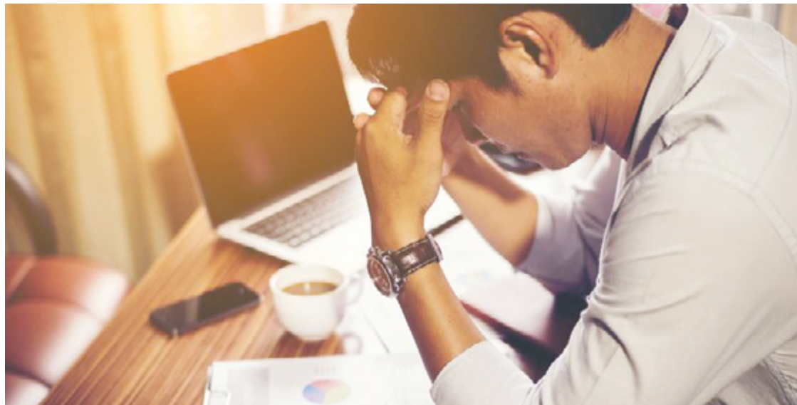
Estudo da International Stress Management (ISMA) considerou a força de trabalho brasileira como a segunda mais estressada do mundo

Estudo da International Stress Management (ISMA) considerou a força de trabalho brasileira como a segunda mais estressada do mundo. De acordo com a pesquisa, 72% dos trabalhadores brasileiros sofrem de estresse e 32%, de síndrome de burnout. O sentimento é tão importante que causa consequências negativas, a curto e longo prazo, no cérebro das pessoas.