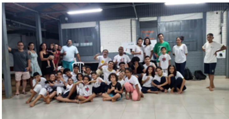
Ao trabalhar em conjunto, escolas, conselhos tutelares e projetos sociais podem criar uma rede de apoio eficaz que protege e empodera as crianças e adolescentes.

conversa, os alunos tiveram a oportunidade de aprender sobre os diferentes tipos de violência sexual, como identificar sinais de abuso e os passos a serem tomados para denunciar tais atos. As discussões enfatizaram a importância de criar um ambiente seguro onde as crianças se sintam confortáveis para relatar qualquer forma de abuso.