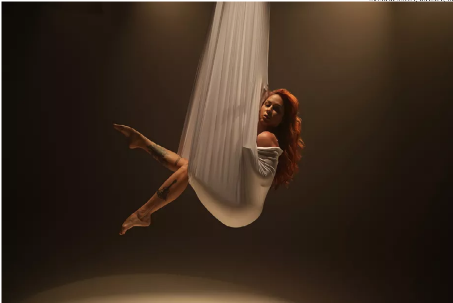
Pitty se apresenta em Pirenópolis durante festival de cerveja, no sábado, 1º

Foi delegado a Gal, inclusive, o primado de lançar uma música composta por Marina.