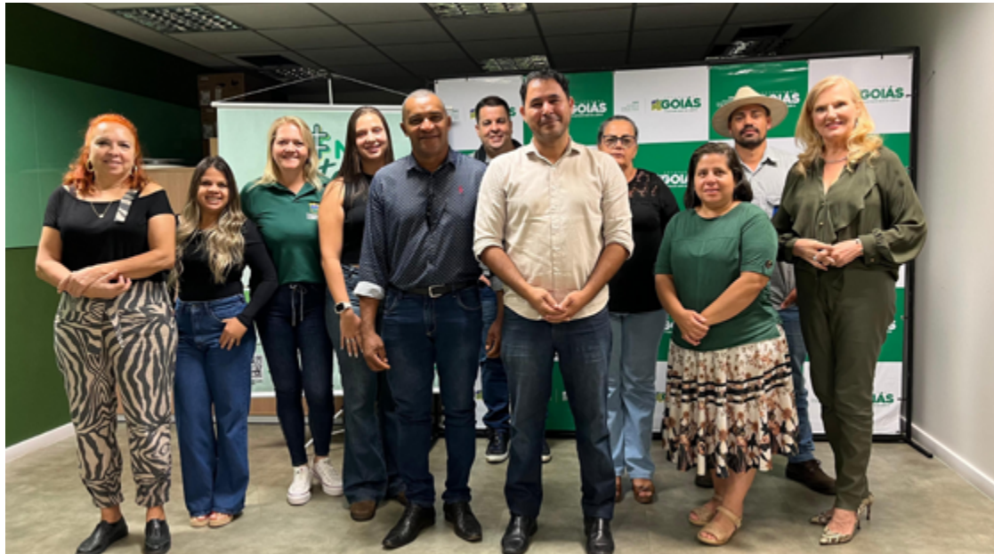
Na última segunda-feira (27), representantes da SEDF-GO e da EMATER começaram uma série de reuniões com os municípios para alinhar ideias e selecionar os pequenos produtores que irão expor na feira

Nesta edição, a feira dará um espaço especial à produção agropecuária. Por esta razão, na última segunda-feira (27), representantes da SEDF-GO e da EMATER começaram uma série de reuniões com os municípios para alinhar ideias e selecionar os pequenos produtores que